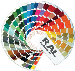
Покрытие порошковой краской по стандарту RAL